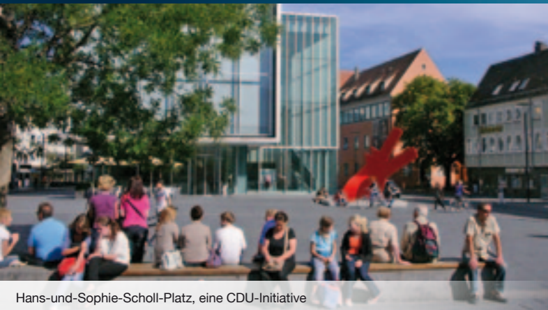
Hans-und-Sophie-Scholl-Platz, eine CDU-Initiative