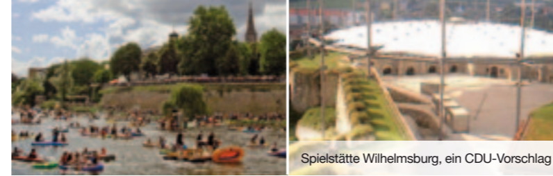
Spielstätte Wilhelmsburg, ein CDU-Vorschlag

Weitere Tätigkeiten: ehrenamtlicher Richter Verwaltungsgericht Sigmaringen, Vorstands-/Beiratstätigkeiten in Vereinen/berufsständischen Organisationen, Ortschaftsrat Gögglingen-Donaustetten