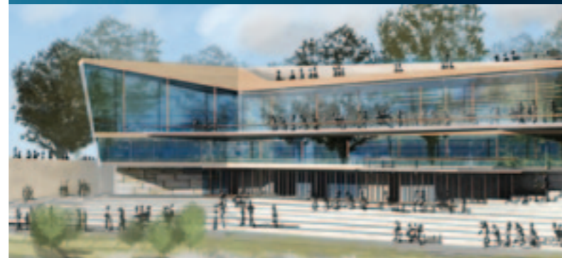
Haus der Donauländer, ein CDU-Vorschlag

„Kompetenz für jedes Lebensalter - vom jüngsten bis zum ältesten Gemeinderatsmitglied.“